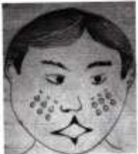
Clã de burití