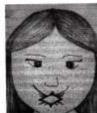
Clã de onça