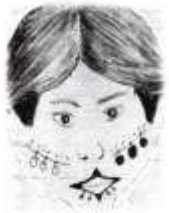
Clã de Avaí