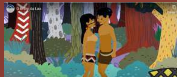
Vídeo “Conversando com as estrelas Worecü”