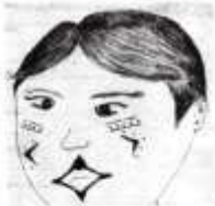
Clã de saúva