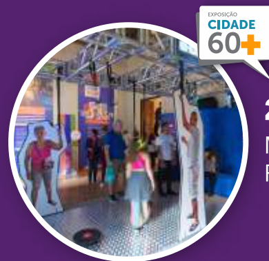
2023 Museu da República

Aborda esse assunto a partir de uma perspectiva interseccional , considerando outros marcadores de diferença – como raça, classe, identidade de gênero, orientação sexual, território, idade .