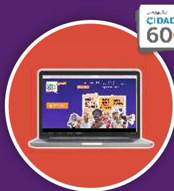
2022 Exposição online