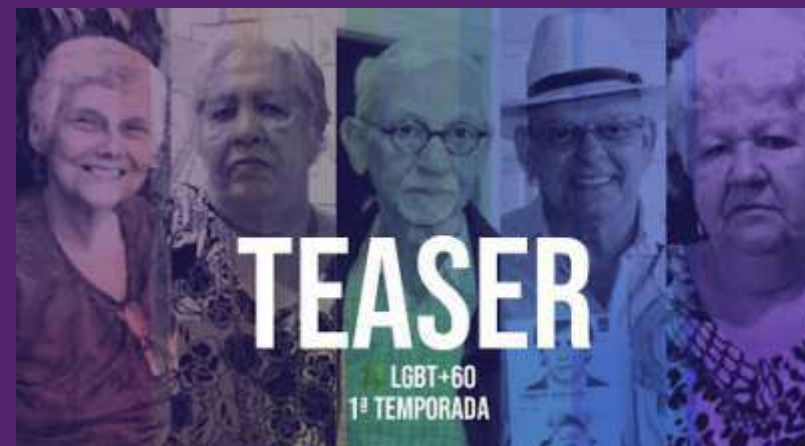
CORPOS QUE RESISTEM, de Yuri Fernandes

Curadoria de filmes com a temática envelhecimento.