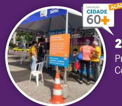
2019 Praia de Copacabana