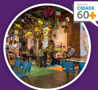
2019 Casa da Ciência UFRJ