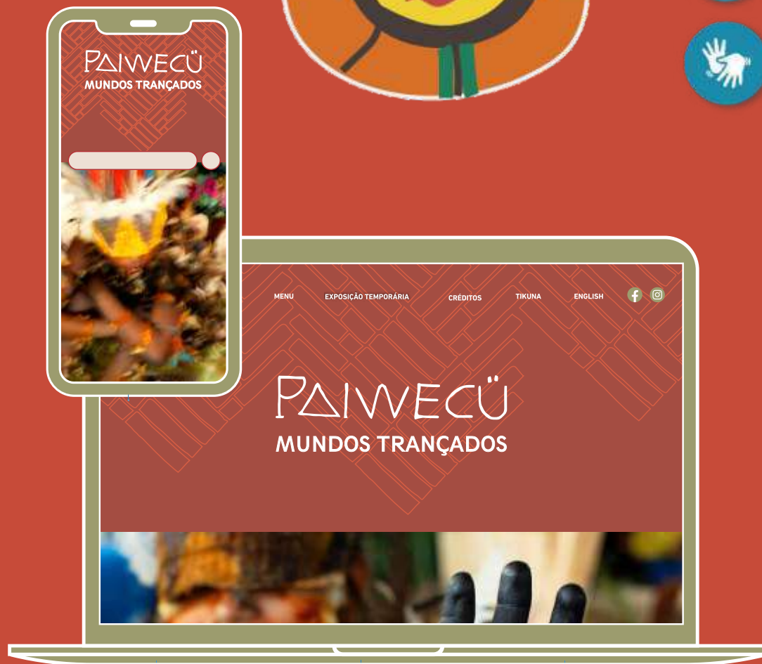
Exemplos de telas