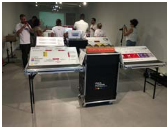
Case montada em exposição