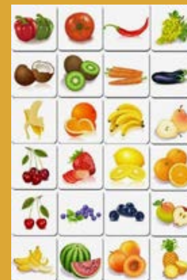
jogo da memória