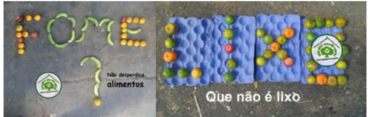
Projeto Escola Verde - Juazeiro do Norte

“A gente não quer só comida, a gente quer comida, diversão e arte” Titãs