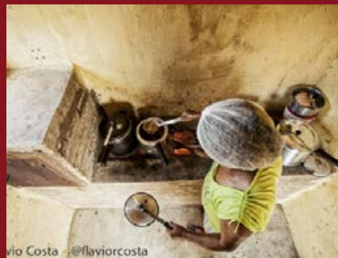
vio Costa @flaviorcosta