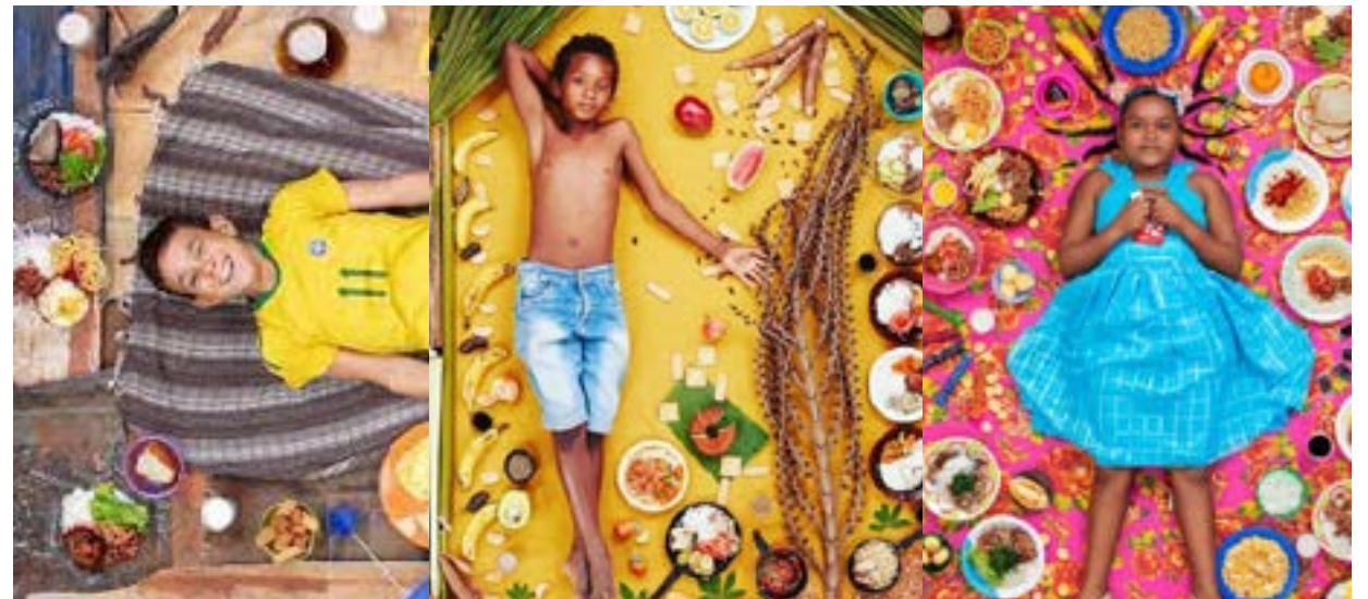
Projeto Daily Bread