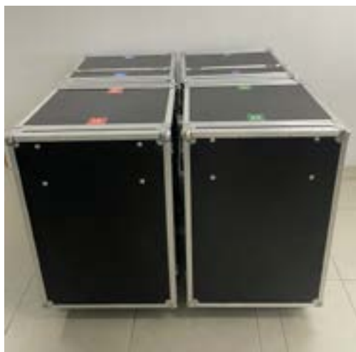
Case fechada para transporte

Versátil e prática para facilitar transporte, montagem, desmontagem e armazenamento.