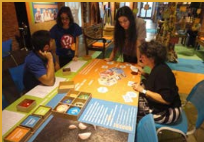
bancada de jogos