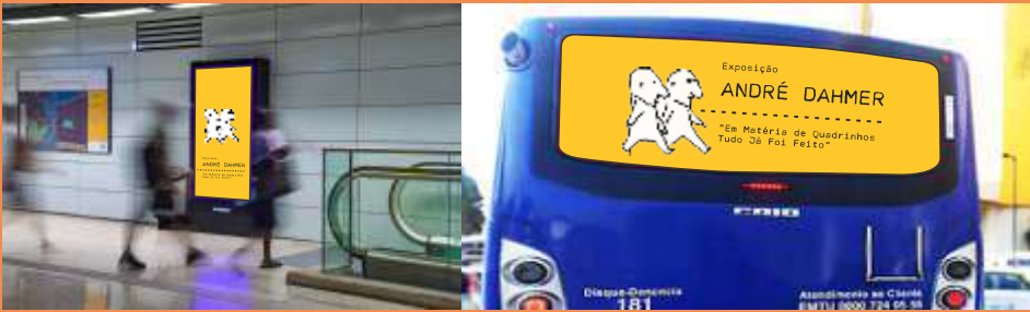
MUB ESTÁTICO METRÔ